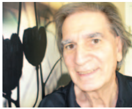
Par Jean Proulx Philosophe